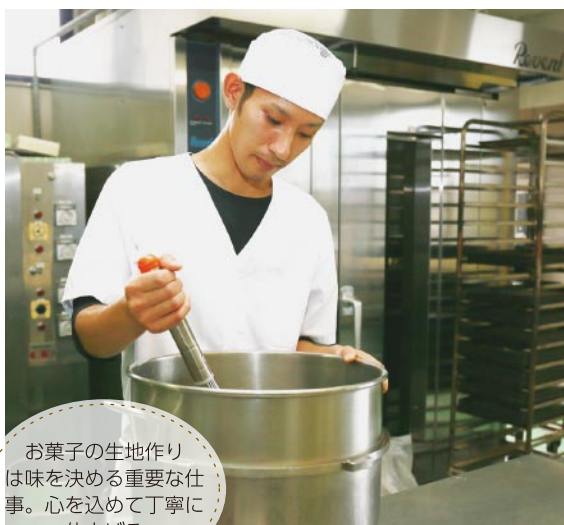
お菓子の生地作りは味を決める重要な仕事。心を込めて丁寧に仕上げる