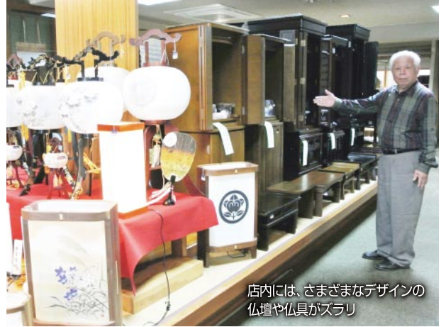
店内には、さまざまなデザインの仏壇や仏具がズラリ

故人をしのぶ心のよりどころとして、また先祖代々のつながりを感じるものとして、大切な存在の仏壇。伊賀市緑ヶ丘にある「仏壇・仏具まえざわ」は、地域の人たちが信頼を寄せる「まちの仏壇屋さん」だ。