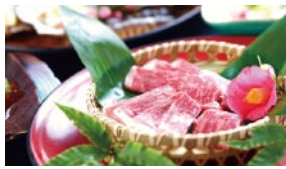
伊賀牛と海鮮を使った自慢の「あみ焼き料理」

見る日本や旅 館について学 びました。 現在は、接 客はもちろん、 旅行企画のプ ランニングや