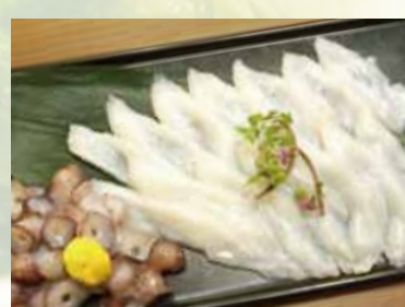
新鮮な生ダコの味はまさに絶品