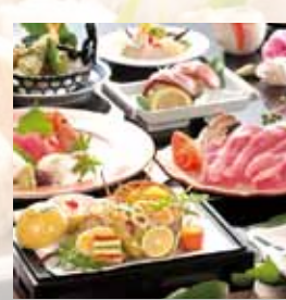
四季折々の味が楽しめる好評のコース料理 ※写真は会席料理の一例です