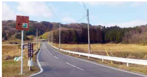
緩やかな稜線を描く「我山」=伊賀市上神戸にて

えられていたという我山。元々の呼び名は「アガヤマ」と呼ばれていたそうです。その由来は定かではありませんが、この地が伊勢神宮の荘園であったことが関係しているといわれています。