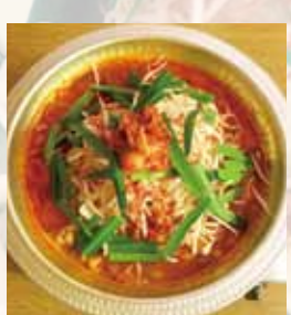
「豚チゲ」も人気。1人前1580円(税別)