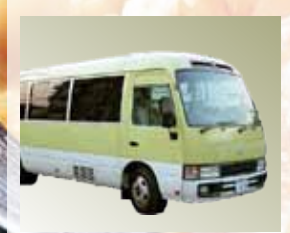
送迎バスで宴会も安心。店内にはキッズルームも完備