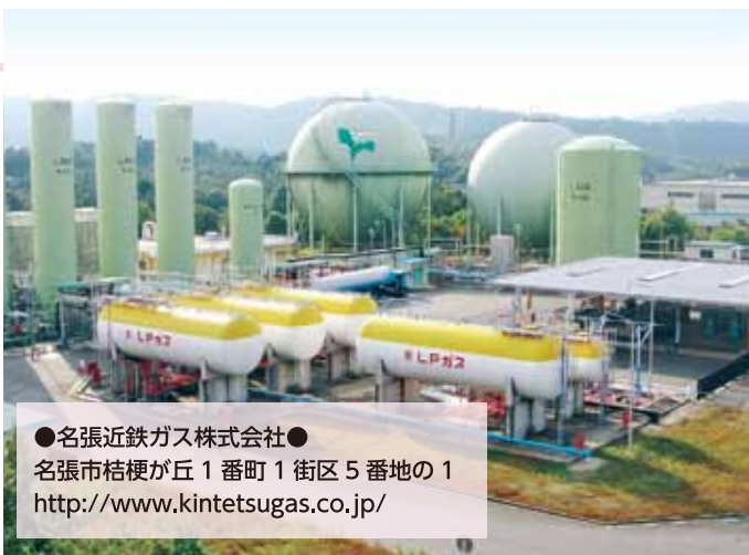
●名張近鉄ガス株式会社● 名張市桔梗が丘1番町1街区5番地の1 http://www.kintetsugas.co.jp/