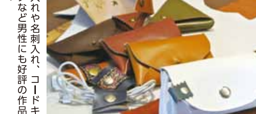
小銭入れや名刺入れ、コードキ ャッチなど男性にも好評の作品 の数々

ーし、イベントな どに出店するよう に。革の縫製作業 は手縫いで一針一 針進めるため、仕 事から帰宅した後 の作業は深夜にお よぶことも。また、 休日でも革の裁断な どの作業に一日か かることもある中、 「夢中になって時間 を忘れるほど、の めりこみますね」 と魅力を語る。 女性向けだけで なく、「お父さんへ」 「彼氏にプレゼン ト」などと、男性 向けの作品を作る こともしばしば。 また、「家族で 持てるものを 作ってほしい」 と声が掛かる こともあるとい う。