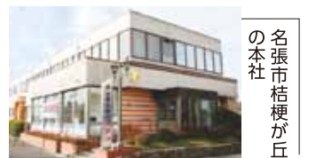
名張市桔梗が丘の本社

そんなさまざまな活動の中には、「総合エネルギー企業」として社会に貢献し、地域を盛り上げていこうという気概が惜しみなく込められている。（PR）