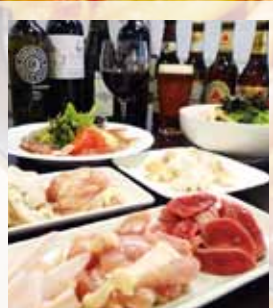
鍋に合わせるお酒のバリエーションも豊富