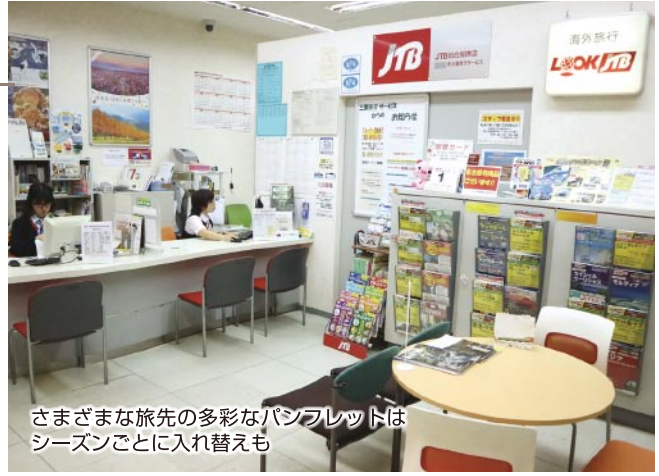
さまざまな旅先の多彩なパンフレットはシーズンごとに入れ替えも

個人の旅行はもちろん、団体旅行など、国内から海外まで、さまざまな企画を取り扱う同店は、今年で20年目。また、会社設立から50年目を迎えます。ますます盛り上がりを見せる。同社オリジナルバスツアー「i・trip」(アイ・トリップ)は、日帰りで行ける添乗員同行の気軽なプランが取りそろえられている。同ツアーは伊賀地区発着なので、遠出しにくい子ど