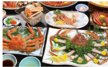
i・tripのカニツアーでは豪華なカニ料理が並び

秋の行楽シーズンに、思い出に残る旅のプランを作る「三重旅行サービス」のアピタ伊賀上野店。国家資格「総合旅行業務取扱管理者」を持つスタッフが多く在籍する同店は、旅行に関する知識の豊富さを生かし、客の希望に沿った旅の提案をしている。