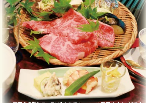
※写真の伊賀牛ロースは2人前です ※写真はイメージです