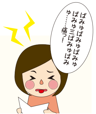
聞き取りやすく話すことでコミュニケーションの幅が広がります。

これらの早口言葉はぜひやってみてください。最初舌をかみそうになりますが、何回も言っているうちに面白いようにスラスラ言えるようになります。このように滑舌の練習には早口言葉が有効に思われがちですが、実は「はへひふへほはほ」という舌をほとんど使わない練習もいいそうです。これは滑舌が悪い原因として「息が足りていない」ということが多いからです。舌をメリハリつけて回すには、たっぷりと「息」が必要です。その息をしっかりと出す練習として「はへひふへほはほ」がいいのです。こちらは何回練習してもなかなか小気味よく言えるようになりません。しかしそれでいいのです。繰り返すことで、たっぷり息を使って話す意識ができてくるのです。