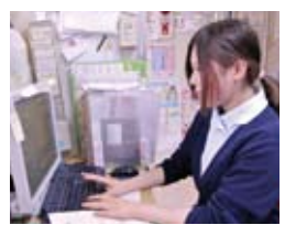
検査の内容や処方された薬の 内容などをパソコンに入力します。

患者さんと接する中で、症状が良くな ってきたという変化を耳にしたり、目にし ているとうれしく なりますね。だから、患者さんの名 前とお顔は早く 覚えるように心掛 けています。