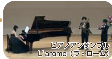
ピアノアンサンブル L'arome(ラ・ローム)