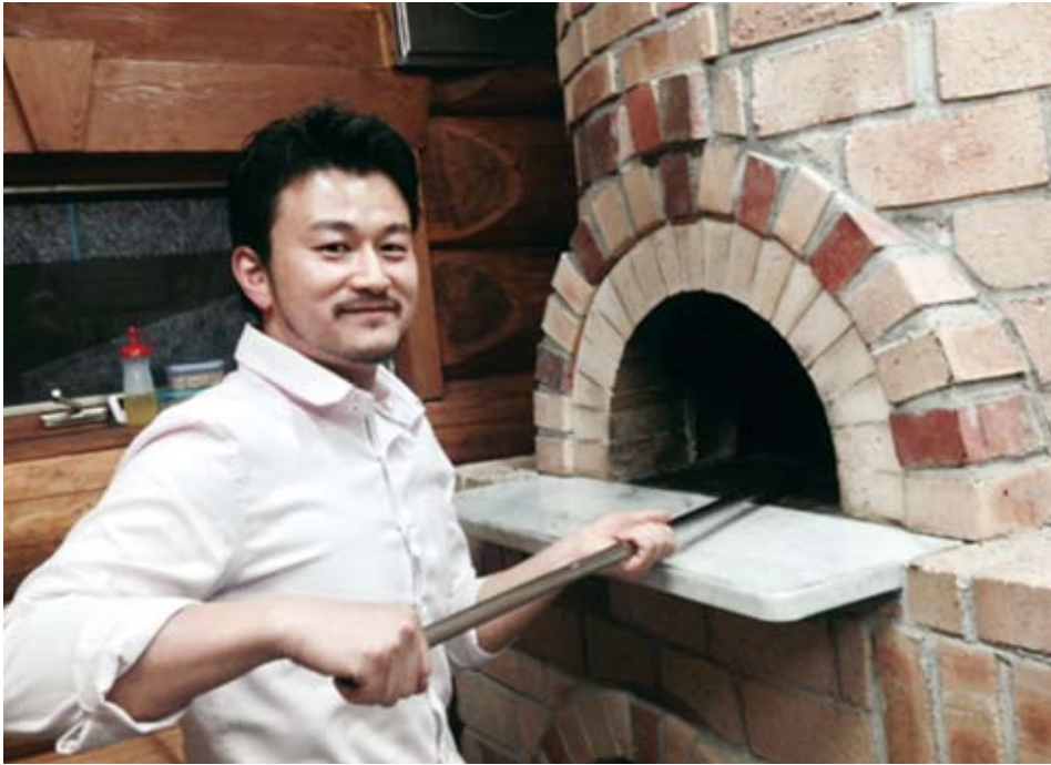
昨年の再オープンで新しくなった釜の前に。2月3日(月)「ほっと。すて〜しょ〜ん 83.5」内、「元気の素本舗」にて放送。