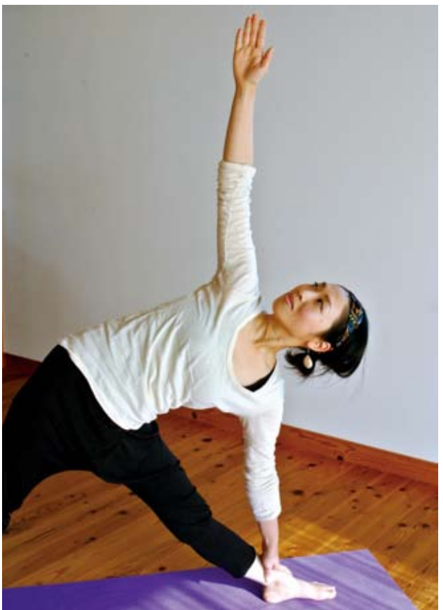
ワークショップや教室では、ポーズと呼吸を意識して、体と心のバランスを整えるという「ハタヨガ」を行う。